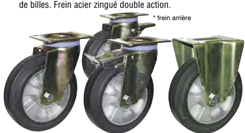
* frein arrière

Fixation par platine. La platine pivote sur un double chemin de billes. Frein acier zingué double action.