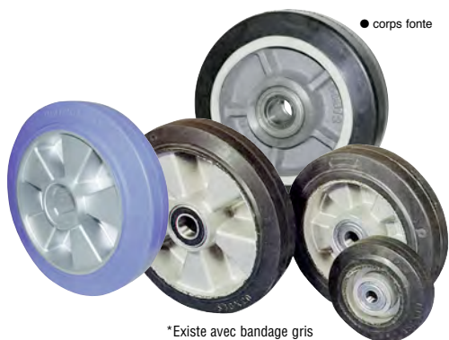
*Existe avec bandage gris

Roue à bandage plein en CAOUTCHOUC NOIR , 68 Shore A, vulcanisé. Jante ALUMINIUM (CA/ALU - 22) injecté, insensible à la corrosion avec roulements à billes.