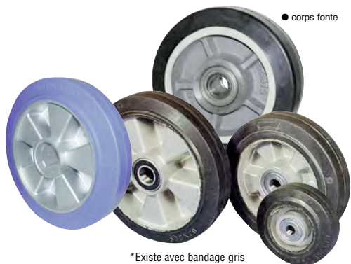
*Existe avec bandage gris

Roue à bandage plein en CAOUTCHOUC NOIR , 68 Shore A, vulcanisé. Jante ALUMINIUM (CA/ALU - 22) injecté, insensible à la corrosion avec roulements à billes.