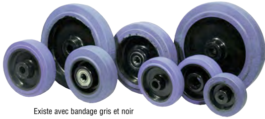
Existe avec bandage gris et noir

*rajouter "G" pour un bandage gris ou "N" pour un bandage noir à la suite du code