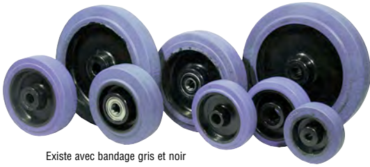
Existe avec bandage gris et noir

*rajouter "G" pour un bandage gris ou "N" pour un bandage noir à la suite du code