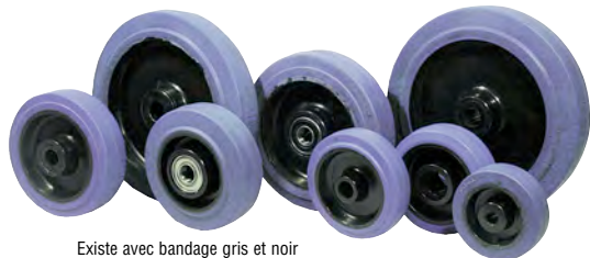
Existe avec bandage gris et noir

Roue à bandage plein en CAOUTCHOUC ÉLASTIQUE BLEU non tachant, 68 Shore A, vulcanisé. Jante POLYAMIDE (CA/PA - 21) avec roulements à billes et/ou roulement à rouleaux normal ou inox.