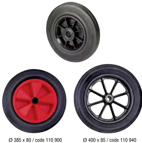
Ø 385 x 80 / code 110 900