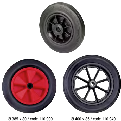
Ø 385 x 80 / code 110 900

Roue à bandage plein en CAOUTCHOUC NOIR pressé sur jante PLASTIQUE (CA/PP - 11) . Alésage lisse ou roulement à rouleaux.