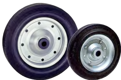
Ø 410 x 90 / code 130 620

Roue à bandage plein en CAOUTCHOUC NOIR sur jante à flasques en ACIER EMBOUTI ZINGUÉ (CA/AC - 13) .